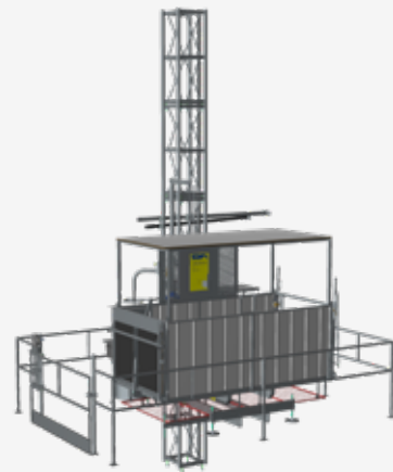
Traliccio piatto - Flat mast - Mât plat